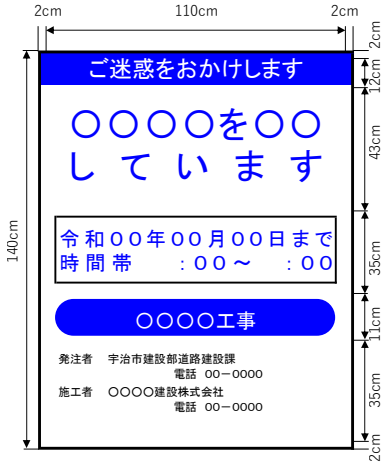
(標示板の記載例) [工事表示板]